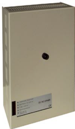
Рис.1 Внешний вид

ООО "КИП и Автоматика" Официальный дистрибьютер "Seitron s.r.l." в России г. Москва, ул. Приорова, д.2а тел/факс: (495) 450-28-37 тел.: (495) 782-99-87, 730-88-76, 450-68-24 450-16-81, 450-08-00, 450-10-41 http://www.seitron.ru e-mail: seitron@kipa.ru