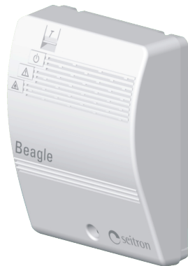
Рис. 1 Внешний вид